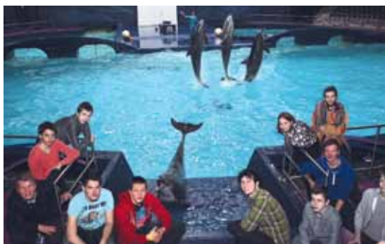
Spetterende start met AutThere-team in het Dolfinarium.