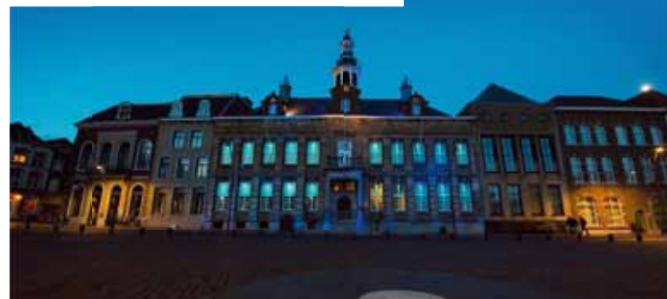
Aandacht voor autisme met de wereldwijde actie: Light it up Blue.