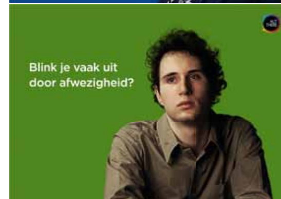
Succesvolle publiekscampagne: www.watdachtjevanmij.nl .